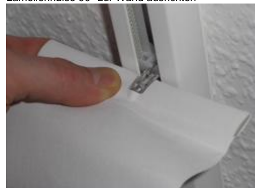
Lamellen in den Lamellenhals einclippen