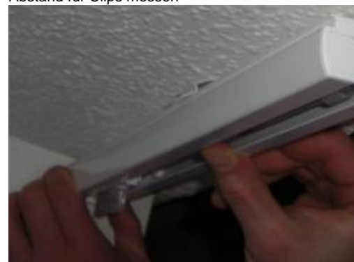
Schiene des Lamellenvorhangs einrasten