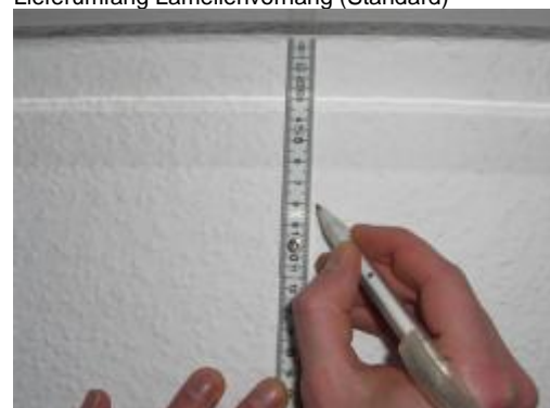
Abstand für Clips messen