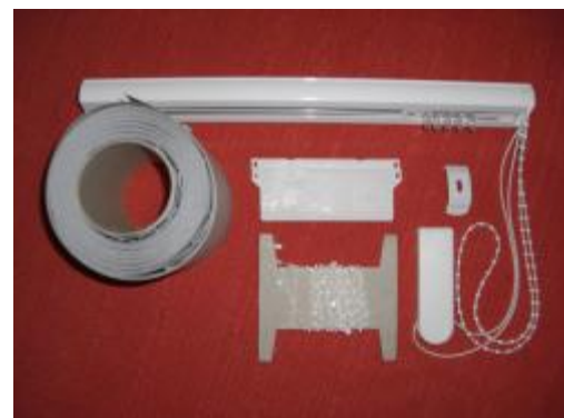
Lieferumfang Lamellenvorhang (Standard)