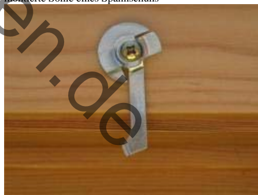
montierter Klemmriegel in der Glasfalz

Der Klemmriegel wird in etwa 3 – 4 cm jeweils von Ende und Anfang der Profile montiert. Sollten mehr Klemmriegel (bei größeren Anlagen) geliefert worden sein, verteilen Sie diese gleichmäßig auf die komplette Breite oben und unten. Das abgewinkelte Ende des Hebels zeigt jeweils in Richtung Plisseemitte. Der an der Scheibe befindliche Zacken des „Dreiviertelmondes“ (Grundplatte des Klemmriegels), zeigt unten immer nach rechts und oben nach links. Das Schraubloch sollte in min. 1,3 cm Abstand zur Fensterscheibe sein. Legen Sie nun das Profil auf und schließen Sie den Klemmriegel.