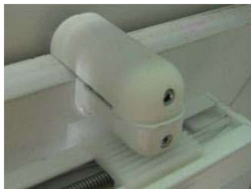
montierter Klemmwinkel auf Fensterrahmen

Der Klemmwinkel ist bereits am Plissee vormontiert. Sie müssen die Winkel jeweils über bzw. unter Ihrem Fensterflügel einhängen. Nun ziehen Sie mit dem beigegefügteten Imbusschlüssel das Plissee am Fensterflügel fest.